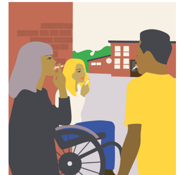
Illustration: Kari Modén

Sedan 2015 erbjuds stöd på andra språk än svenska med flerspråkig rådgivare eller tolksamtal.