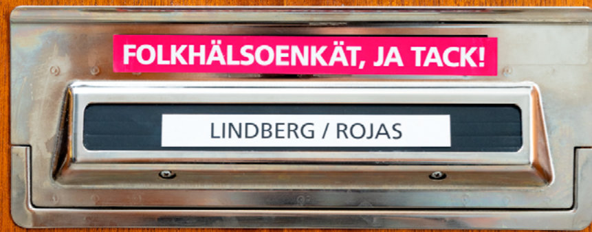
Bild från kampanjen som visades i sociala medier, framtagen av byrån Familjen tillsammans med CES enhet för kommunikation.